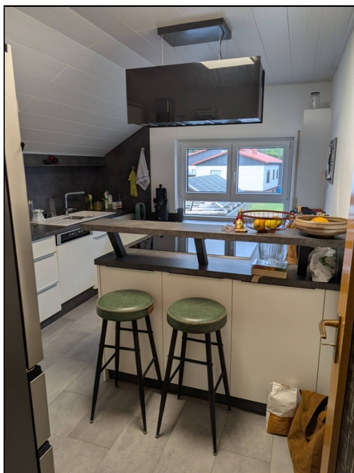
Küche mit kleinem Essplatz