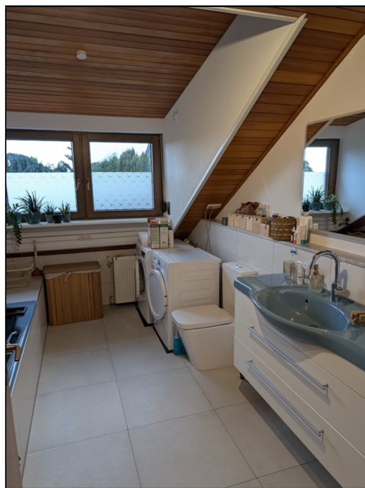
helles Tageslichtbad mit Wanne und Dusche