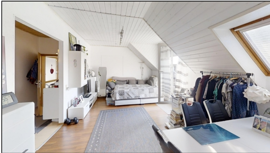
Helles-freundliches Wohn- Esszimmer