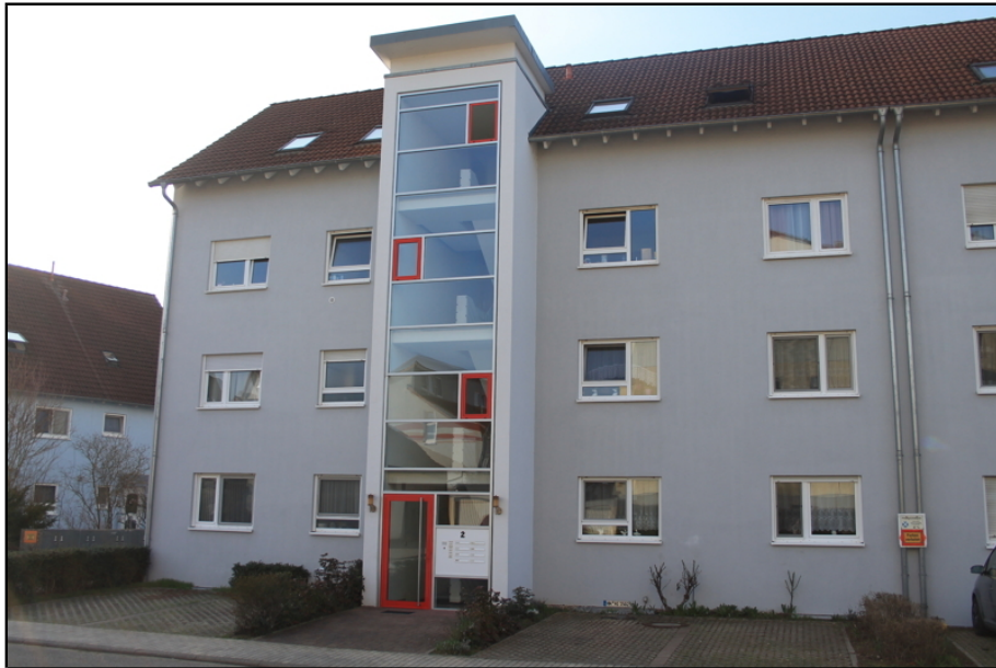
Ansicht von der Straße