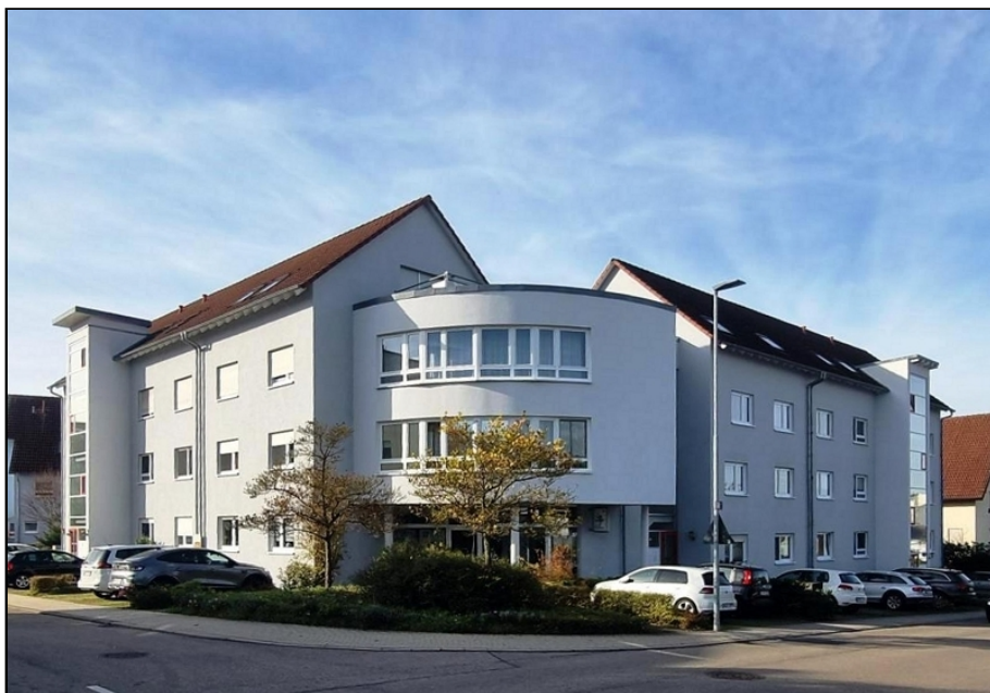
Ansicht Wohnung links DG.