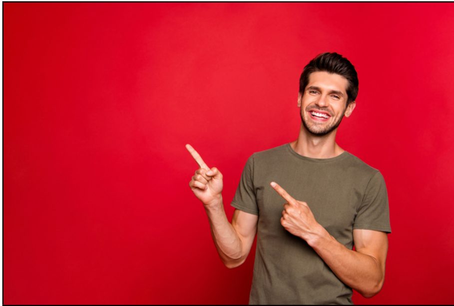
perfekt für Anleger