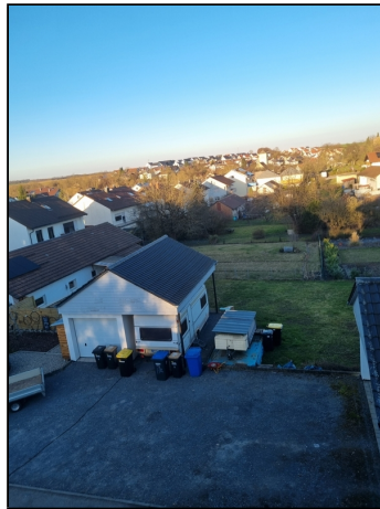
schöne Baulücke im Wohngebiet