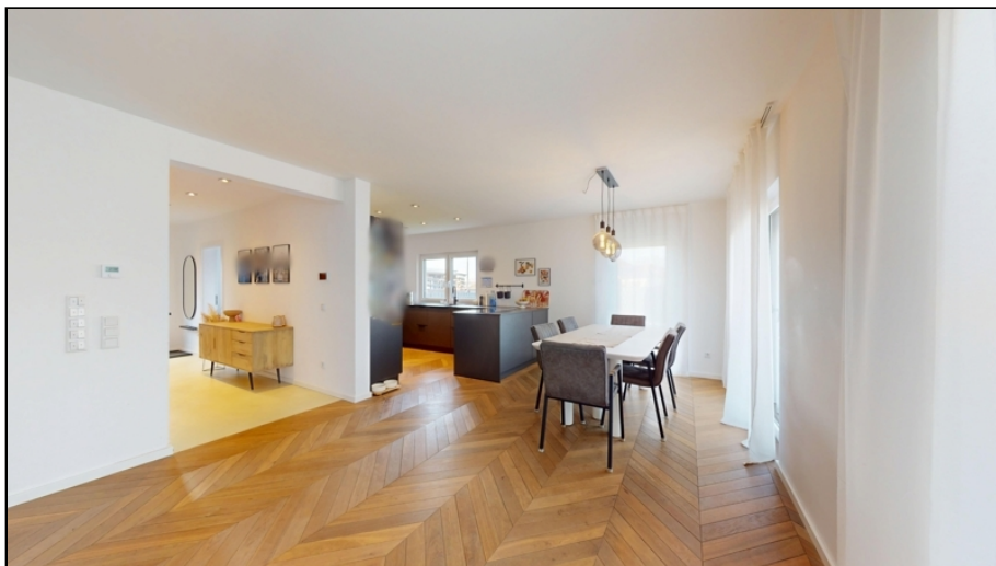
große, offene Wohn-Essküche