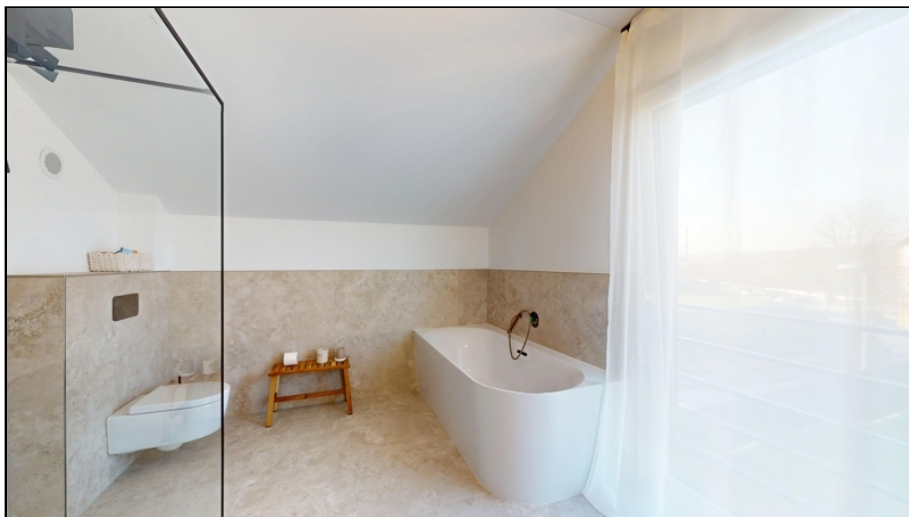
helles, wunderschönes Bad