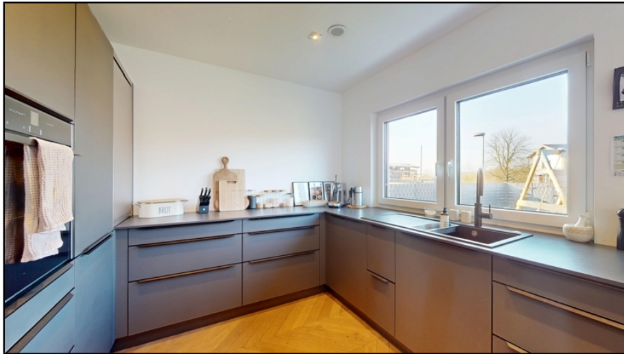
die Küche bietet viel Platz