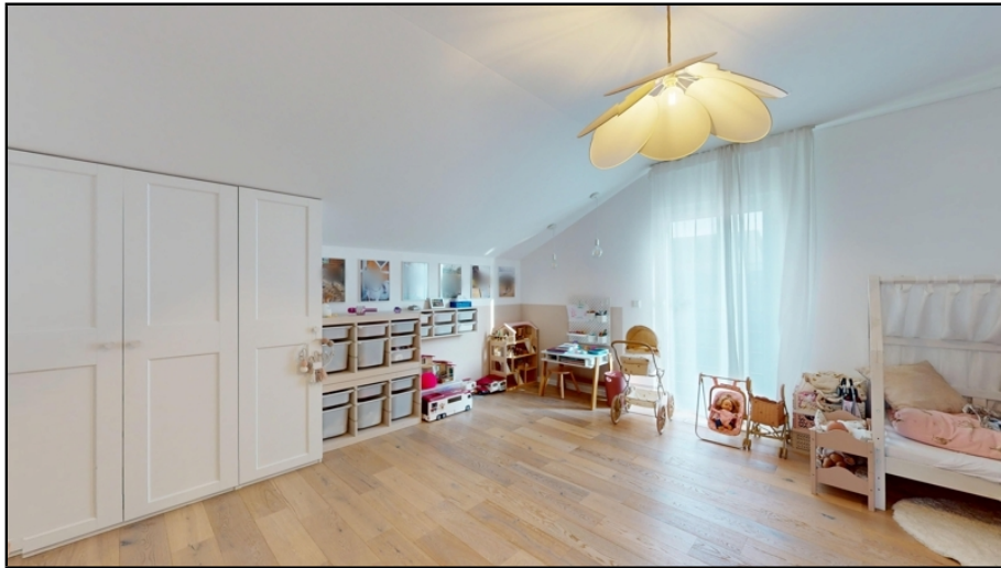
freundliches, großes Kinderzimmer