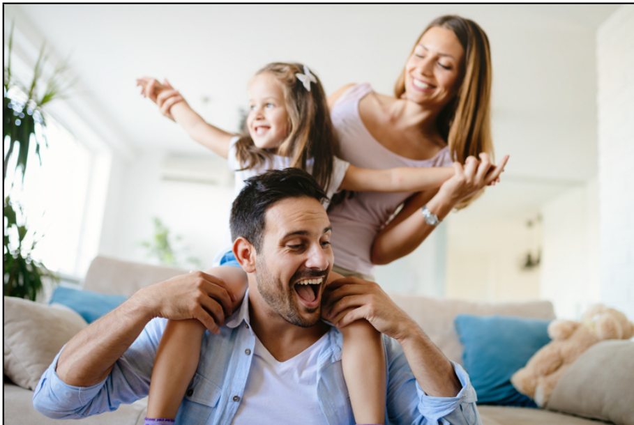
direkt einziehen und ankommen