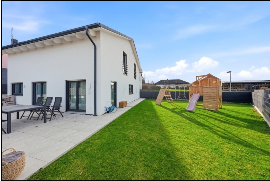
sonniger, blickgeschützter Garten