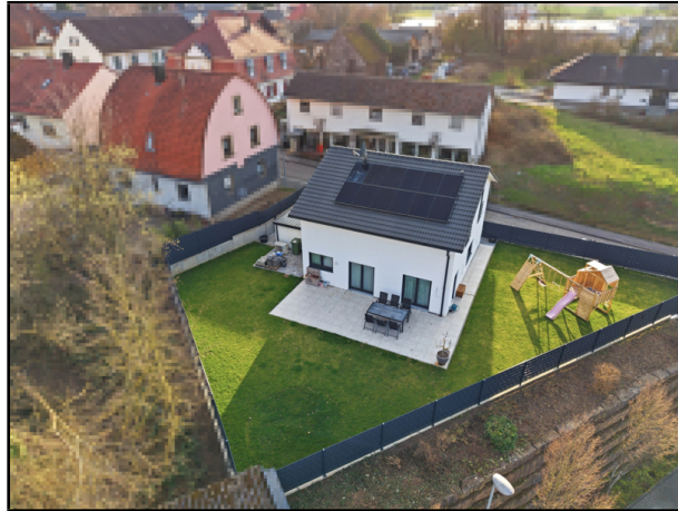
Gesamtansicht diesen tollen Hauses