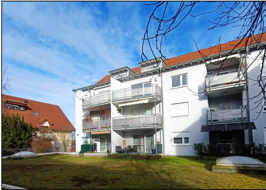
Ansicht von hinten