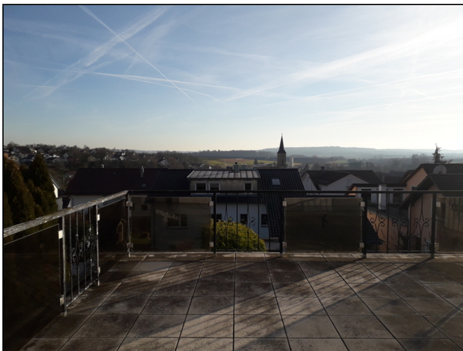
Ausblick vom Balkon OG.