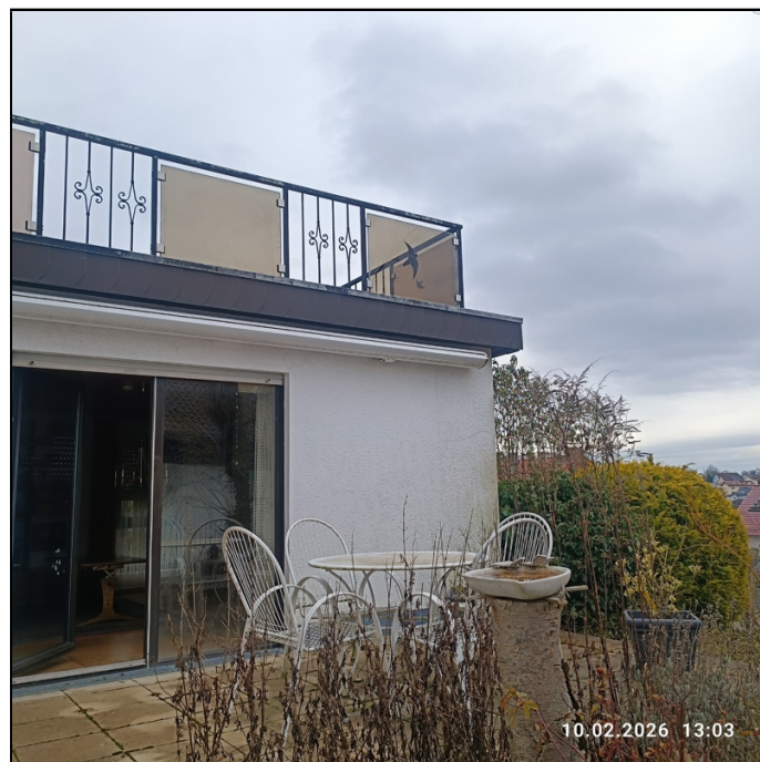
Terrasse + Balkon