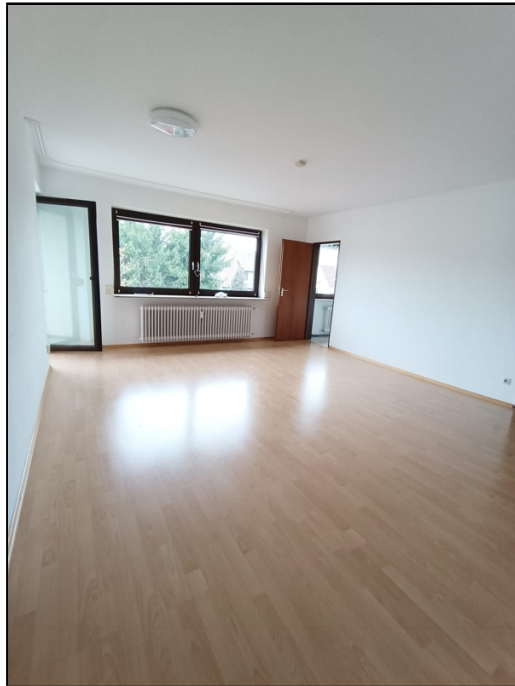
Wohnzimmer mit Zugang Balkon