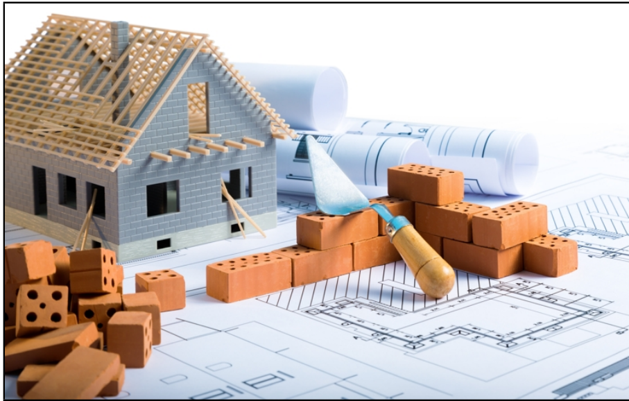
Ihr neues Traumhaus individuell planen