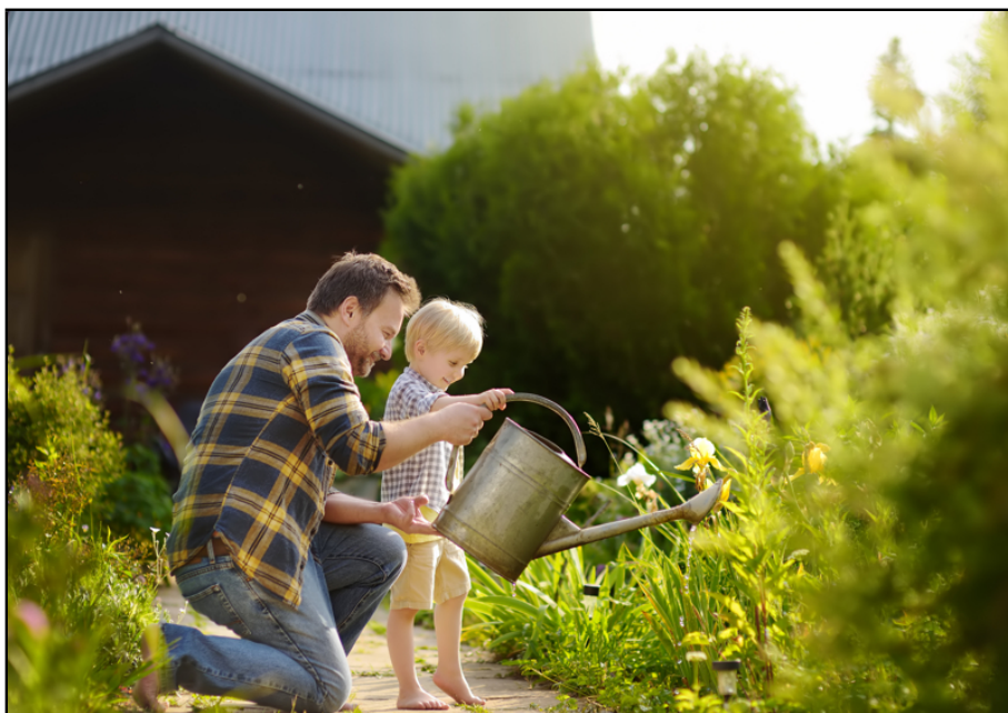
Ihr neuer Garten