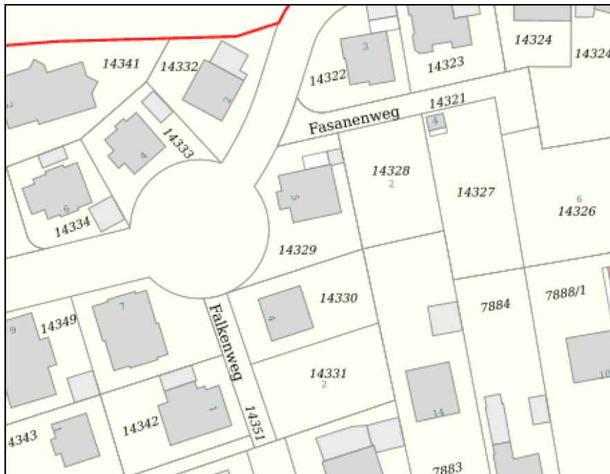
LP_Flst. Nr. 14328