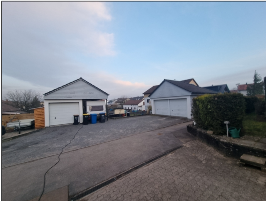
3 Garagen, 1 Carport bereits vorhanden