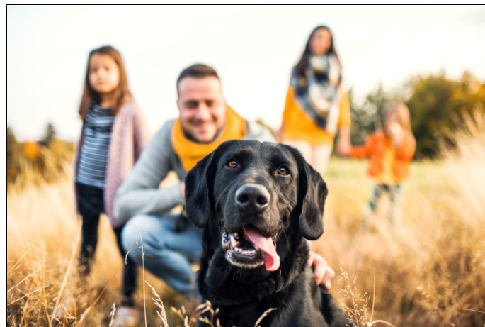
Ideales Grundstück für die Familie

Bauplatz gekauft, Garagen schon erstellt. Baugenehmigung für das Haus vorhanden.