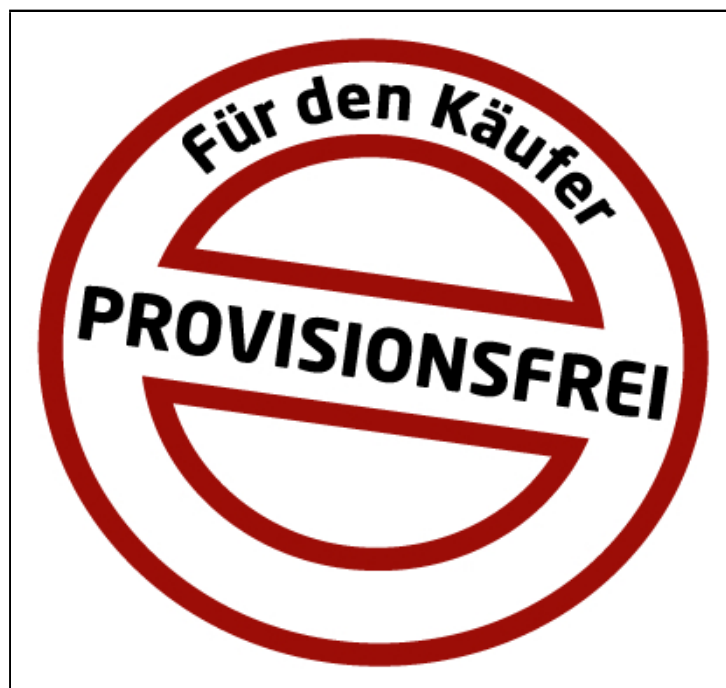
provisionsfrei für Sie