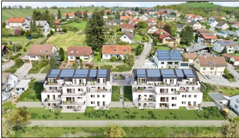
Sulzfeld K18 Südwestansicht