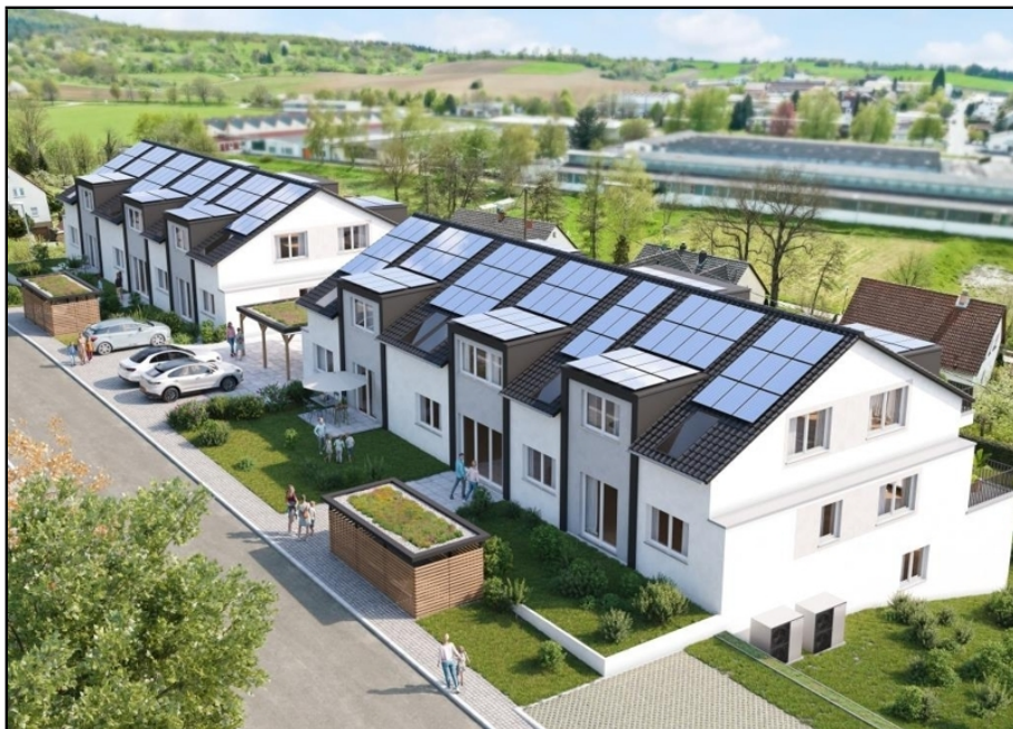
Sulzfeld K18 Nordansicht