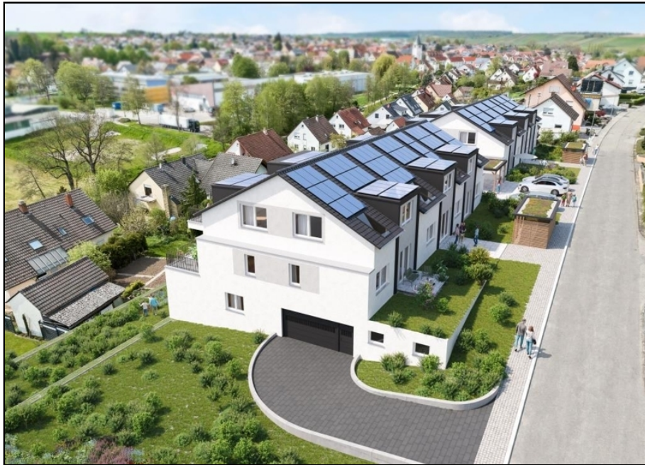
Sulzfeld K18 Ostansicht