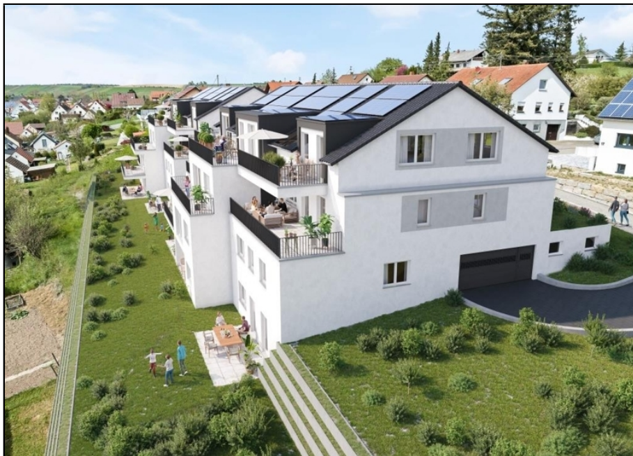
Sulzfeld K18 Südostansicht